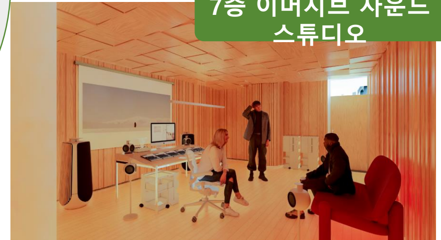
7층 이머시브 사운드 스튜디오